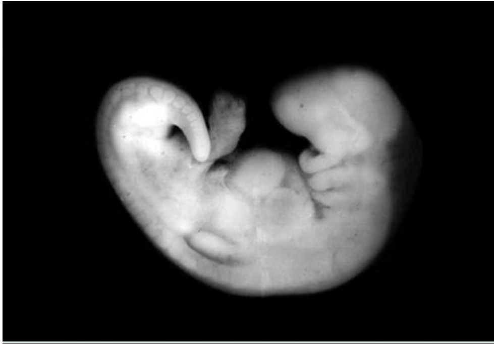
Фото эмбриона до 5й недели беременности.

У эмбриона формируется сердце, головка, ручки, ножки и хвост. Определяется жаберная щель. Длина эмбриона на пятой неделе доходит до 6 мм.