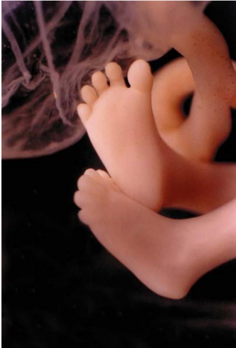
Развитие плода на фото ножки: неделя 11

У малыша сформированы руки, ноги и веки, а половые органы становятся различимы (вы можете узнать пол ребенка). Плод начинает глотать, и уж если ему что-то не по вкусу, например, если в околоплодные воды (мама что-то съела) попало что-то горькое, то малыш станет морщиться и высовывать язык, делая меньше глотательных движений. Кожица плода выглядит прозрачной.