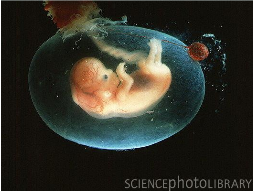
Развитие плода по неделям фото: неделя 7-8

У плода определяется лицо, можно различить ротик, носик, ушные раковины. Головка у зародыша крупная и ее длина соотносится с длиной туловища; тельце плода сформировано. Уже существуют все значимые, но пока еще не полностью сформированные, элементы тела малыша. Нервная система, мышцы, скелет продолжают совершенствоваться.