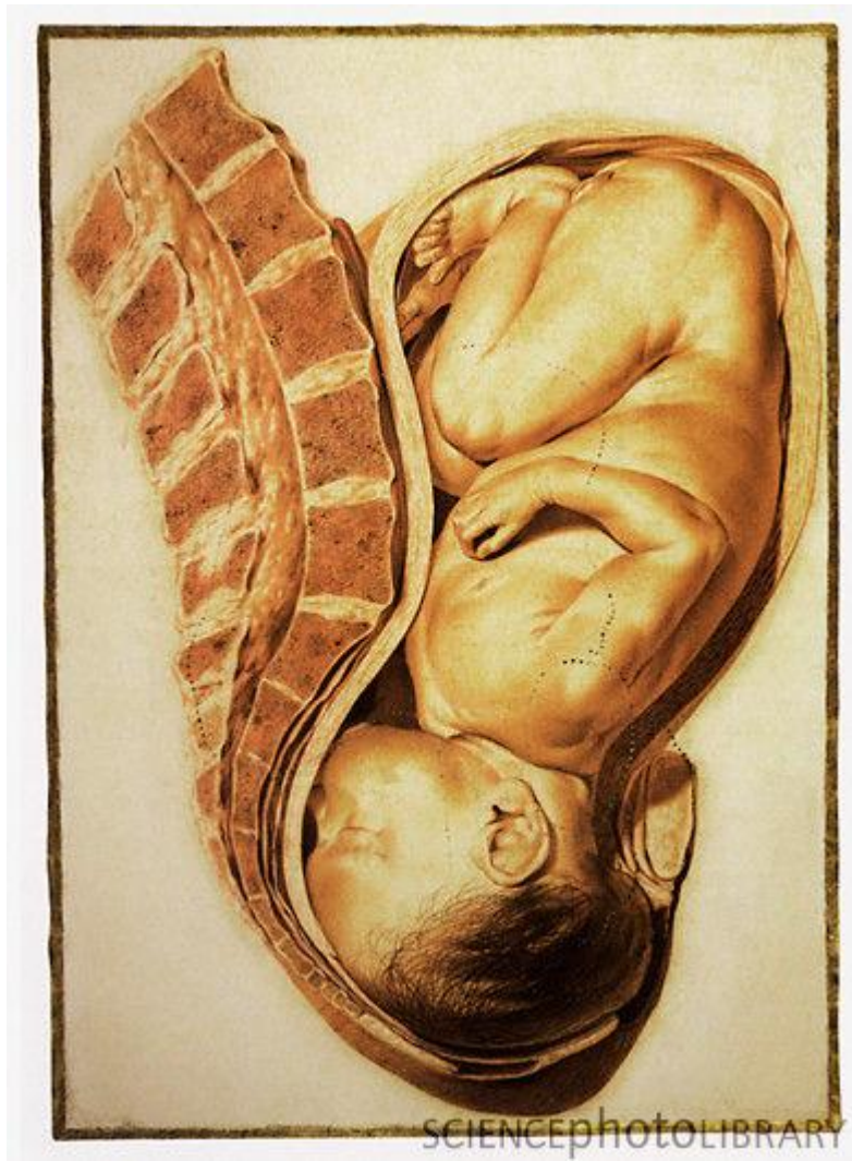
Развитие плода по неделям фото: неделя 40

Малыш отлично усвоил движения мамы, знает когда она спокойна, взволнована, расстроена и реагирует на это своими движениями. Плод за внутриутробный период привыкает к перемещениям в пространстве, поэтому малыши так любят когда их носят на руках или катают в коляске. Для младенца это совершенно естественное состояние, поэтому он успокоится и заснет, когда его покачают.