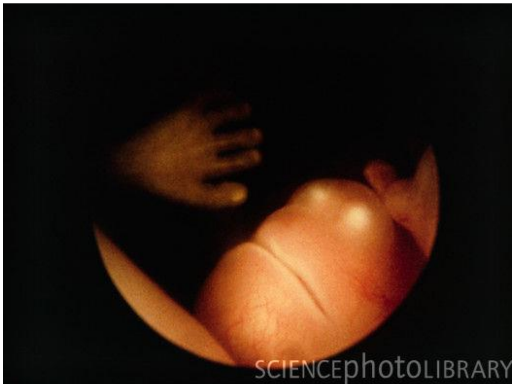
Развитие плода: 11–14 недели

Удивительно, когда мама прикладывает руку к животу, малыш пытается освоить мир и старается прикоснуться своей ручкой «с обратной стороны».