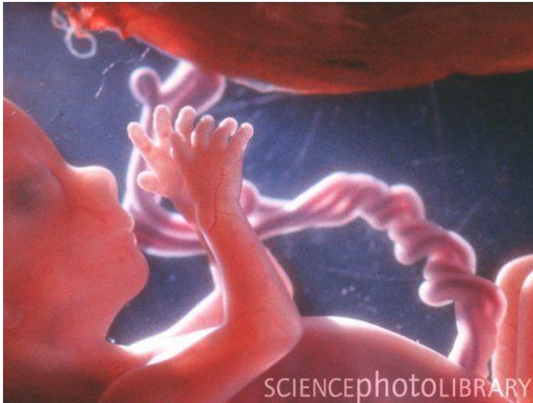
Развитие плода: неделя 12