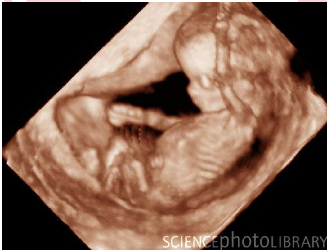
Фото плода 12 недель на 3d УЗИ