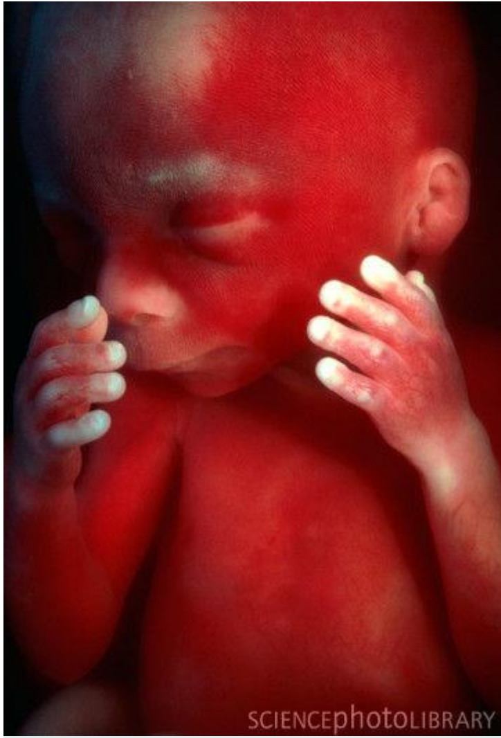
Развитие плода по неделям фото: неделя 19

Малыш сосет пальчик, становится более энергичным. В кишечнике плода образуется псевдо-кал — меконий, начинают работать почки. В данный период головной мозг развивается очень активно.